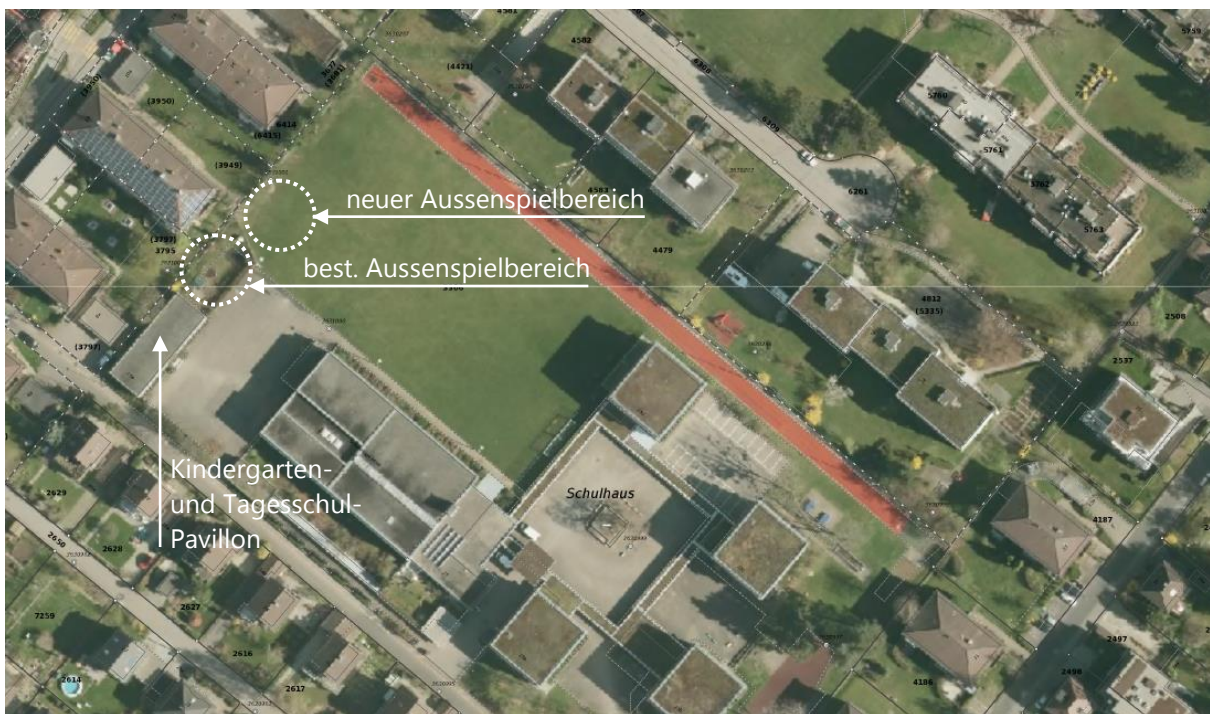
Abbildung 1: Übersicht Areal Mösligen

An der Besprechung vom 19. Juni 2017 (mit der Motionärin, den Schulvertretern, der Hauswirtschaft und der Abteilung Hochbau) wurde festgelegt, dass bis zu den Herbstferien 2017 eine Verbesserung des Aussenbereiches des Kindergartens und Tagesschule anzustreben ist. Die Variante „Alternativ-Spielplatz“ mit Beteiligung von Schülern, Eltern, Lehrpersonen, Unternehmern etc. musste schon zu Beginn aus zeitlichen und logistischen Gründen fallengelassen werden.