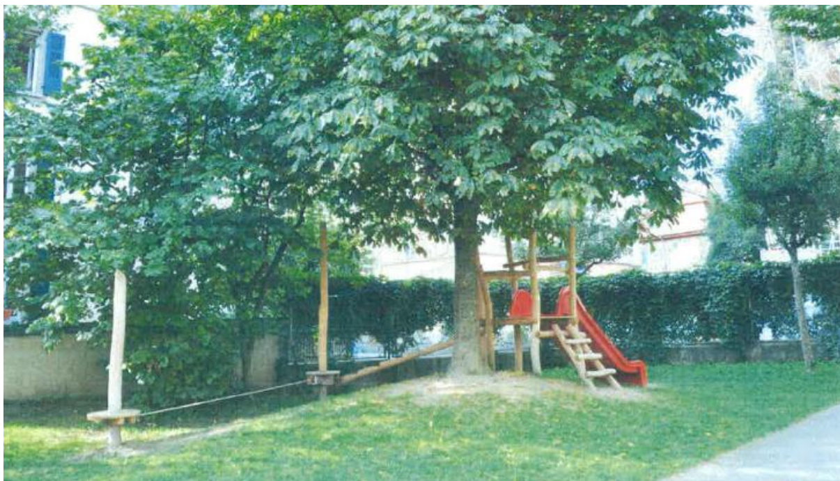
Abbildung 3: Referenzbild einer ähnlichen Anlage (Spielplatz Neufeld, Bern)

Die Finanzierung konnte über das laufende Budget 2017 (Unterhalt Kindergärten) sowie einem Beitrag der Schule Möslì sichergestellt werden. Die Kosten wurden zu 3/4 durch den Hochbau und 1/4 durch die Schule übernommen.