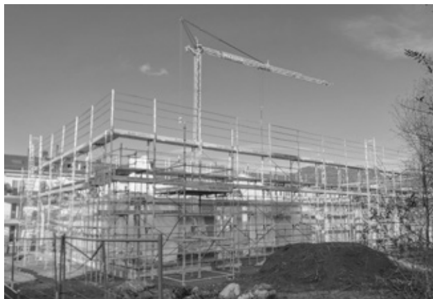
Baustelle Schiessplatzweg 34

gestartet, der Doppelkindergarten mit Tagesschule am Schiessplatzweg 34. Mit den Abbruch- und Rohbauarbeiten wurde begonnen. Die Aufrichte des Holzmodulbaus ist Ende Januar 2019 und die Inbetriebnahme im Sommer 2019 geplant.