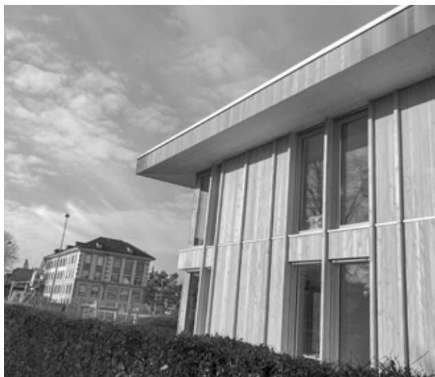
Im Herbst wurde das zweite Ersatzneubauprojekt

Die Gesamtplanung Kindergärten hat die Abteilung Hochbau im Berichtsjahr stark gefordert. Am 29. März 2018 erfolgte der Spatenstich und am 9. August 2018 bereits die Aufrichtefeier des ersten Kindergartenneubaus an der Mitteldorfstrasse 12a (Eselweid). Das Gebäude wurde termingerecht fertiggestellt und konnte im Dezember 2018 vom Totalunternehmer übernommen werden. Im Januar 2019 werden die ersten beiden Kindergartenklassen den Betrieb aufnehmen.