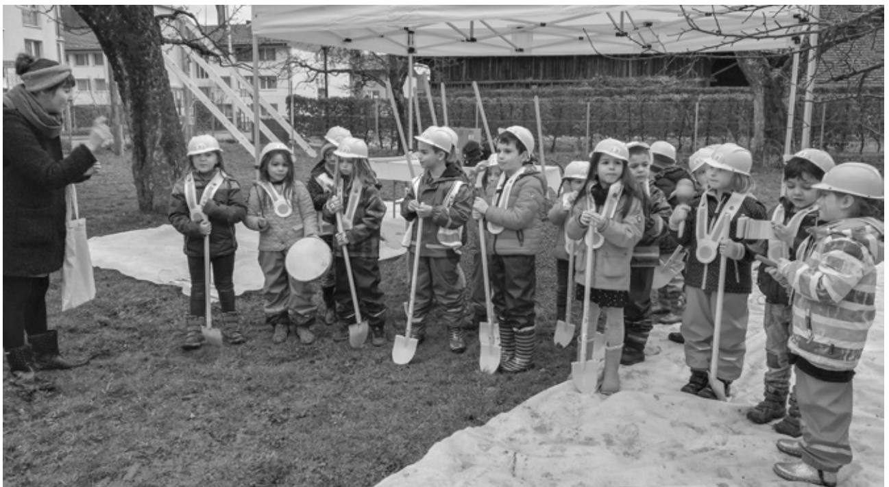
Spatenstich Doppelkindergarten, Mitteldorfstrasse 12A

Ende März 2018 wurde zusammen mit dem Hochbau in der Aula Dennigkofen ein Informationsanlass zum aktuellen Stand der Schulraumplanung durchgeführt.