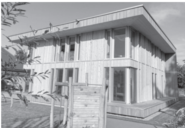
Neubau Kindergarten Mitteldorfstrasse 12a

Das Berichtsjahr war aus baulicher Sicht neben zahlreichen kleineren und mittleren Unterhaltmassnahmen geprägt durch die Inbetriebnahme der ersten Neubauten im Rahmen der Gesamtplanung Kindergärten, die Konkretisierung der Schulraumplanung sowie die Erarbeitung des Hauswartkonzepts. Aus baupolizeilicher Sicht sticht der hohe Aufwand für die Bearbeitung der Gesuche und Einsprachen für Mobilfunkantennen ins Auge. Die seit längerer Zeit kritische Ressourcensituation wurde durch die Kündigung einer langjährigen Sachbearbeiterin, den Abgang eines Projektleiters und die noch immer vakante Stelle in der Bauverwaltung nicht einfacher. Wie in den letzten Jahren mussten deshalb zahlreiche Vorhaben sistiert und auf umfangreiche Dienstleistungen Dritter zurückgegriffen werden.