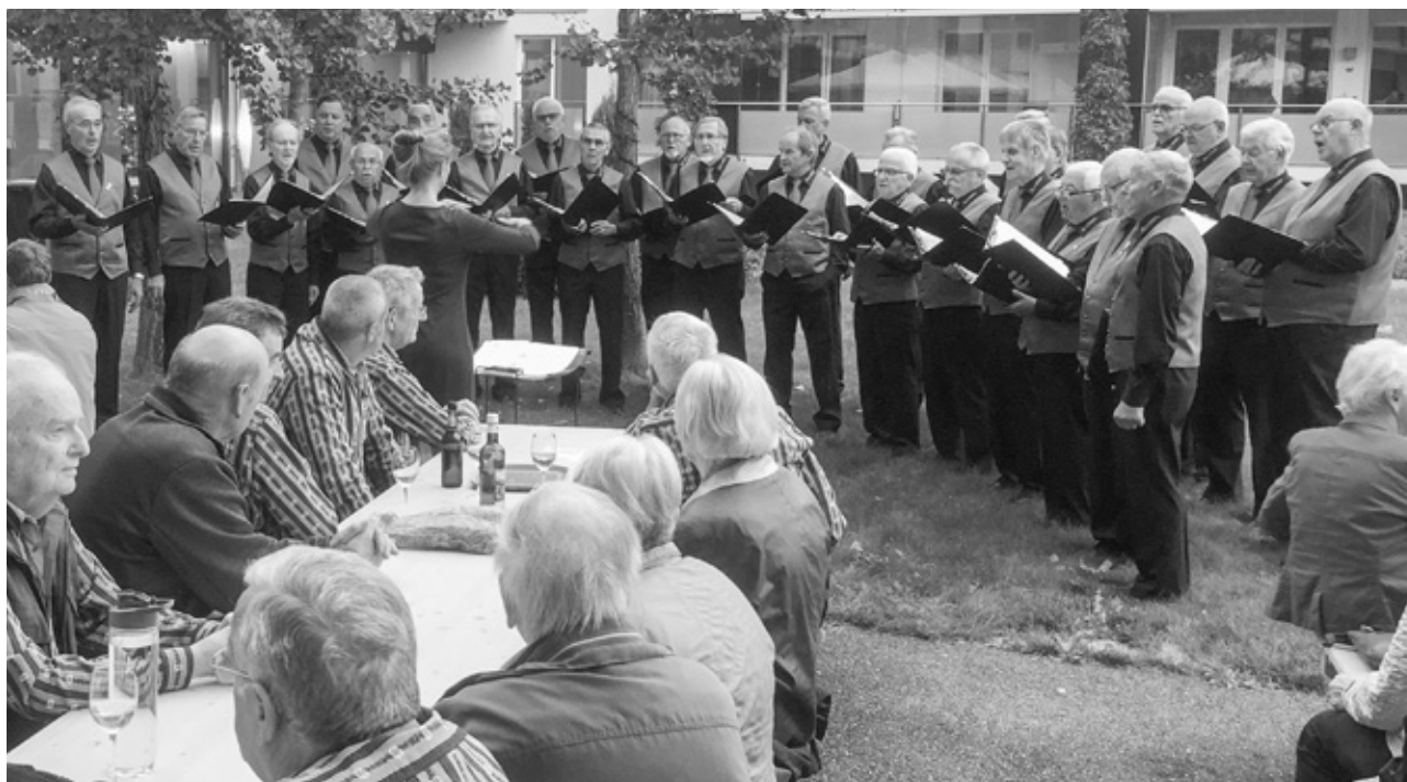
Park-Konzert Tertianum Männerchor

Am Samstag, 29. Juni 2019, konnte das zweite multikulturelle Streetfood-Festival auf dem Schularéal Bernstrasse durchgeführt werden. An 20 verschiedenen Esständen und Foodtrucks wurden feine Köstlichkeiten aus nah und fern angeboten. Parallel dazu fand auf dem Rasenplatz von Seiten der Jugendarbeit ein Street Soccer Turnier statt. Als Rahmenprogramm und Ambiente dienten eine offene Bühne und ein DJ. Der gut besuchte Event löste bei Jung und Alt ein sehr positives Feedback aus.