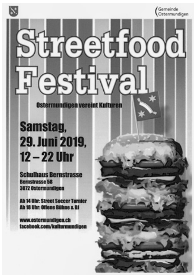
Streetfood-Festival 2020 Flyer