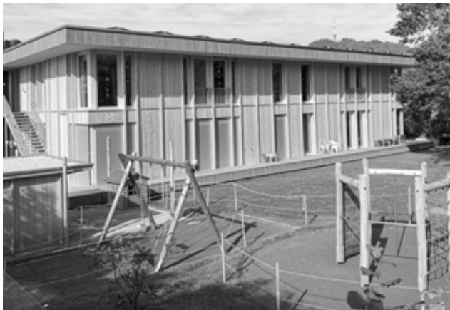
Kindergarten mit Tagesschule Schiessplatzweg 34