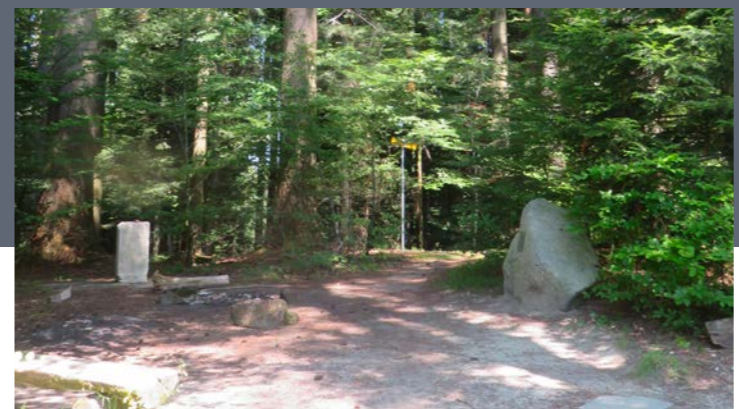
Kasthofer-Grabstein und -Gedenkstätte

Anlässlich des politischen Umschwungs im Jahre 1830/31 (Regeneration) betrat Kasthofer auch das Feld der Politik. 1831 wurde er Verfassungsrat. Als Vertreter des Oberlands gehörte er dem Grosse Rat an. Von 1837 bis 1843 war er Regierungsrat und Forstmeister in einer Person. Doch statt dass diese Beförderung ihm geholfen hätte, seine forstlichen Absichten besser umzusetzen, verhedderte er sich in ausweglose Grabenkämpfe und machte sich sogar seine besten Freunde zu Feinden. Er wurde als Regierungsrat nicht wiedergewählt und seines Amtes als Forstmeister enthoben. Das Leben Kasthofers endete tragisch. Trotzdem: Dank seinem unermüdlichen Einsatz und grossem Wissen hat er das Fundament gelegt, auf welchem eine moderne schweizerische Forstwirtschaft errichtet werden konnte.