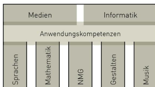
Abbildung 1: Struktur Modullehrplan

Zyklus 1 (Kindergarten bis 2. Klasse) Kennen und Einordnen von Medien