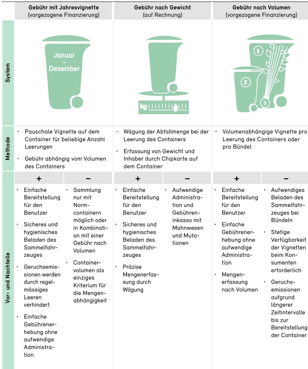
Tabelle 4 Bewährte Entsorgungssysteme für Grünabfälle (Grüngut)