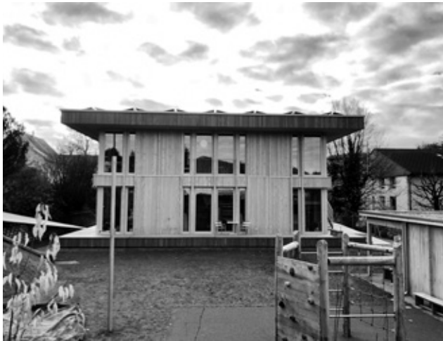
Neubau Kindergarten Dennigkofenweg 197

Das Berichtsjahr war aus baulicher Sicht neben zahlreichen kleineren und mittleren Unterhaltmassnahmen geprägt von der Inbetriebnahme des Kindergartenneubaus am Dennigkofenweg 197 und des Schulraumprovisoriums Mösli. Zudem konnten die Gesamtplanung Schulanlage Mösli und die Gesamtplanung Schulanlage Rothus einen grossen Schritt vorangebracht werden. Die teilweise rasch zu realisierenden betrieblichen Vorkehrungen in Bezug auf eine mögliche Energiemangellage waren für den Hochbau eine grosse Herausforderung.