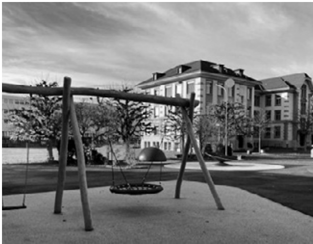
Neuer Spielbereich beim Pausenplatz