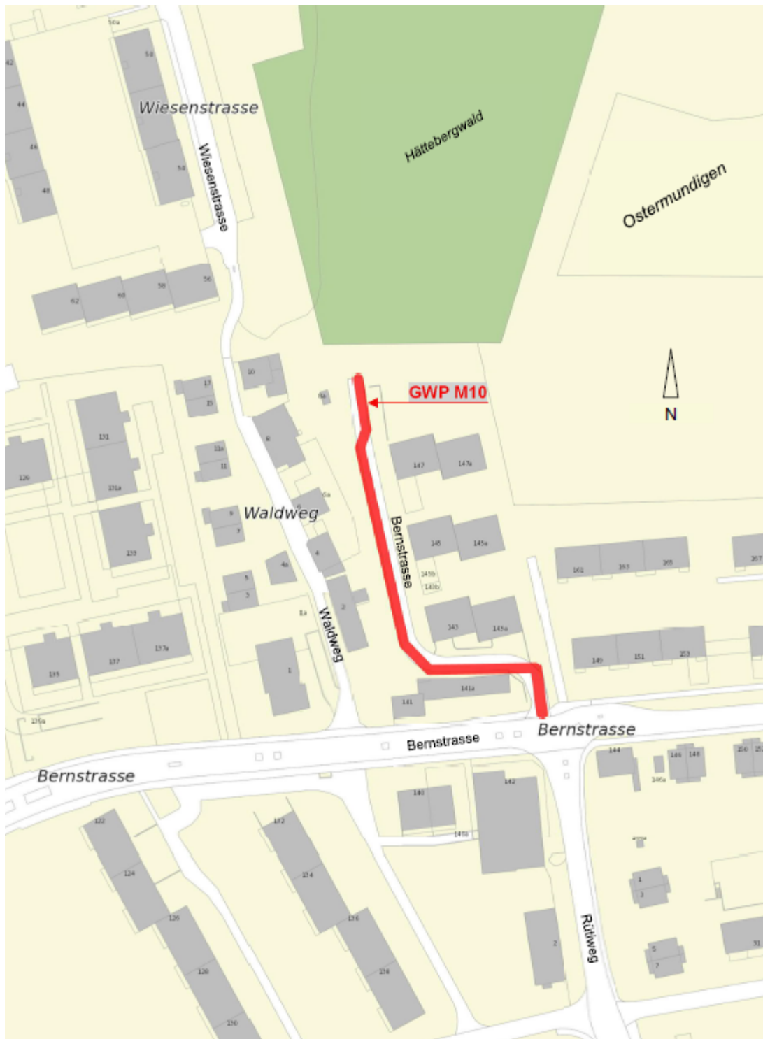
Abbildung 2: Projektperimeter GWP-Massnahme Nr. 10 (Bernstrasse - Waldweg)