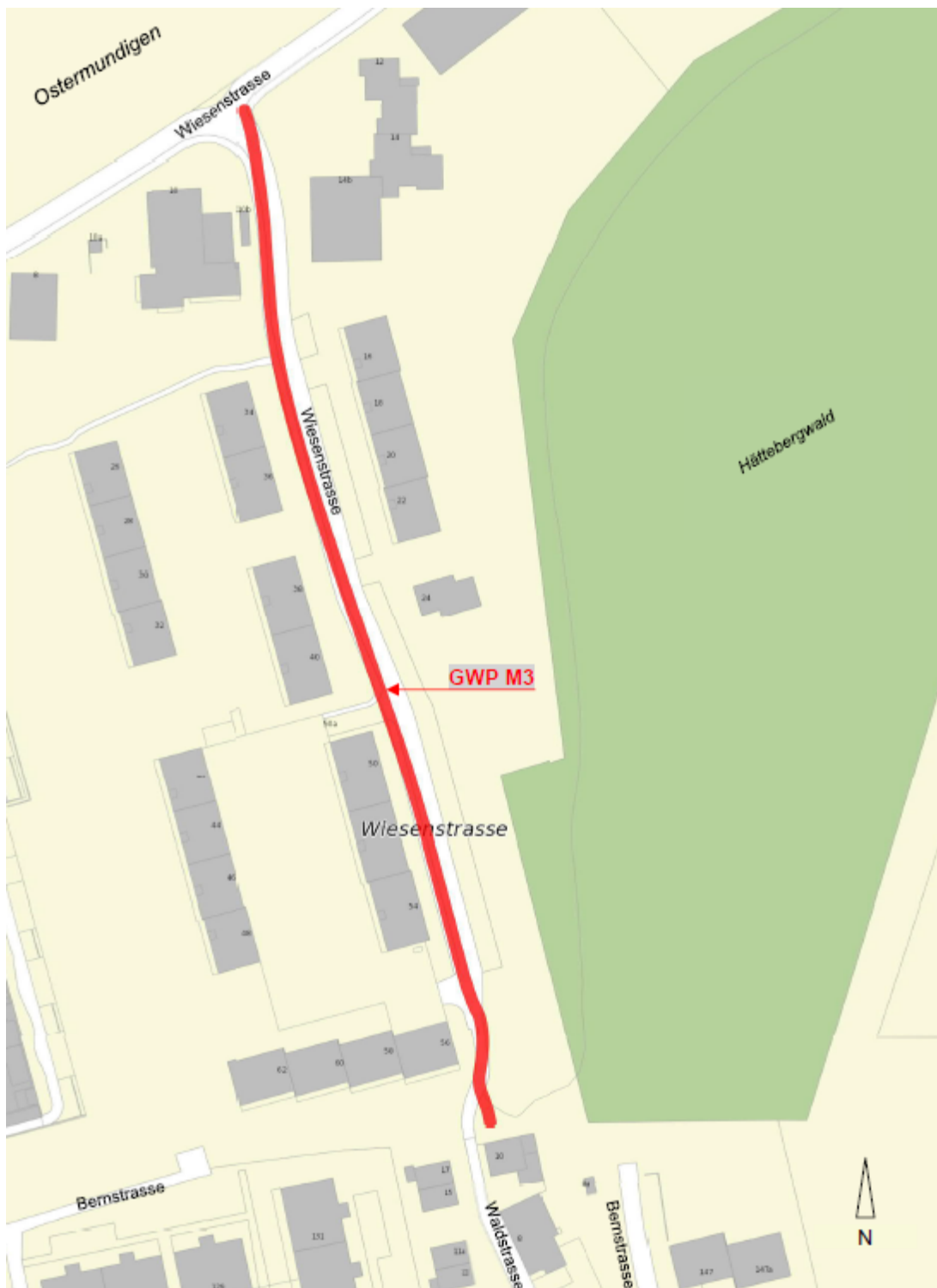
Abbildung 1: Projektperimeter GWP-Massnahme Nr. 3 (Wiesenstrasse - Waldweg)