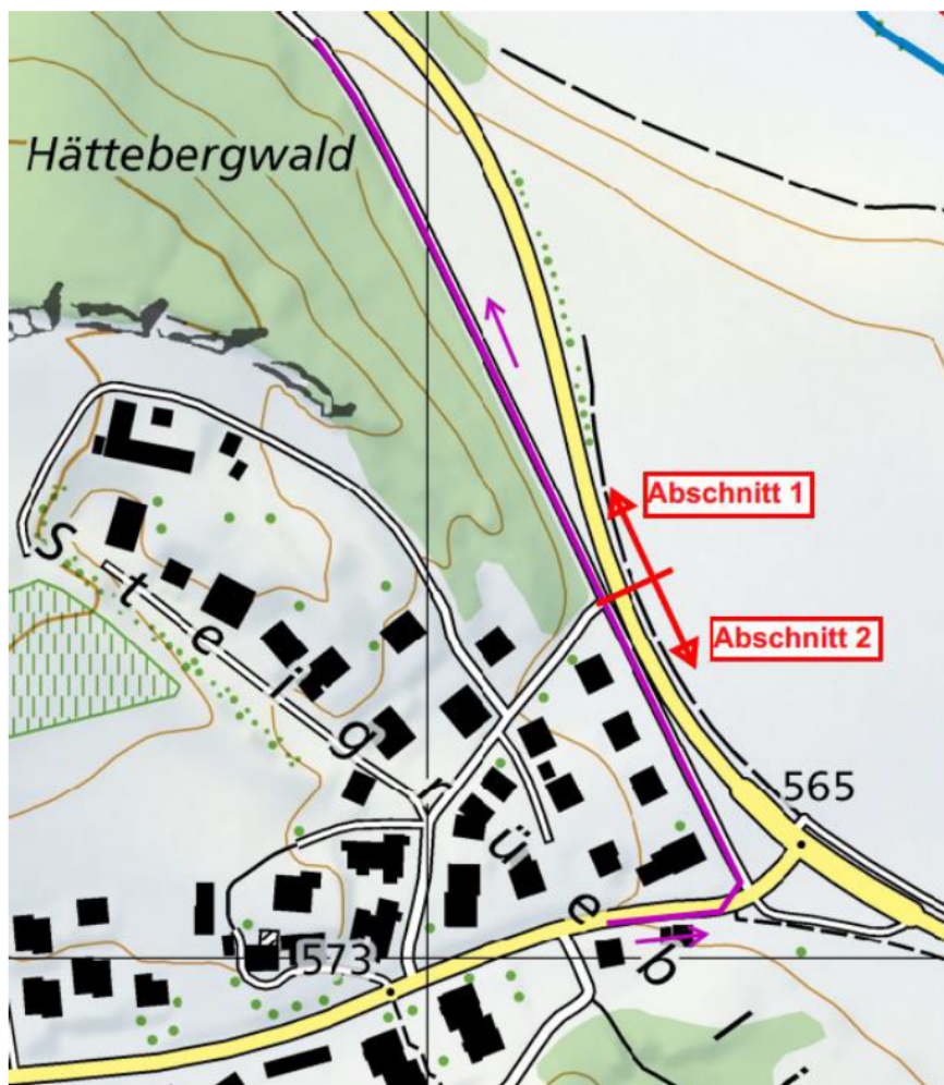
Abbildung 1, Mischabwasserleitung im Projektperimeter mit Abschnitt 1 (Rörswilstrasse entlang Hättebergwald) und Abschnitt 2 (Rörswil- und Bernstrasse)

In der Rörswilstrasse und in einem Teil der Bernstrasse wurde die öffentliche Mischwasserkanalisation auf einer Länge von rund 460 Metern aus hydraulischen Gründen erneuert und erweitert. Diese Arbeiten erfolgten in den Jahren 2020 bis 2022.