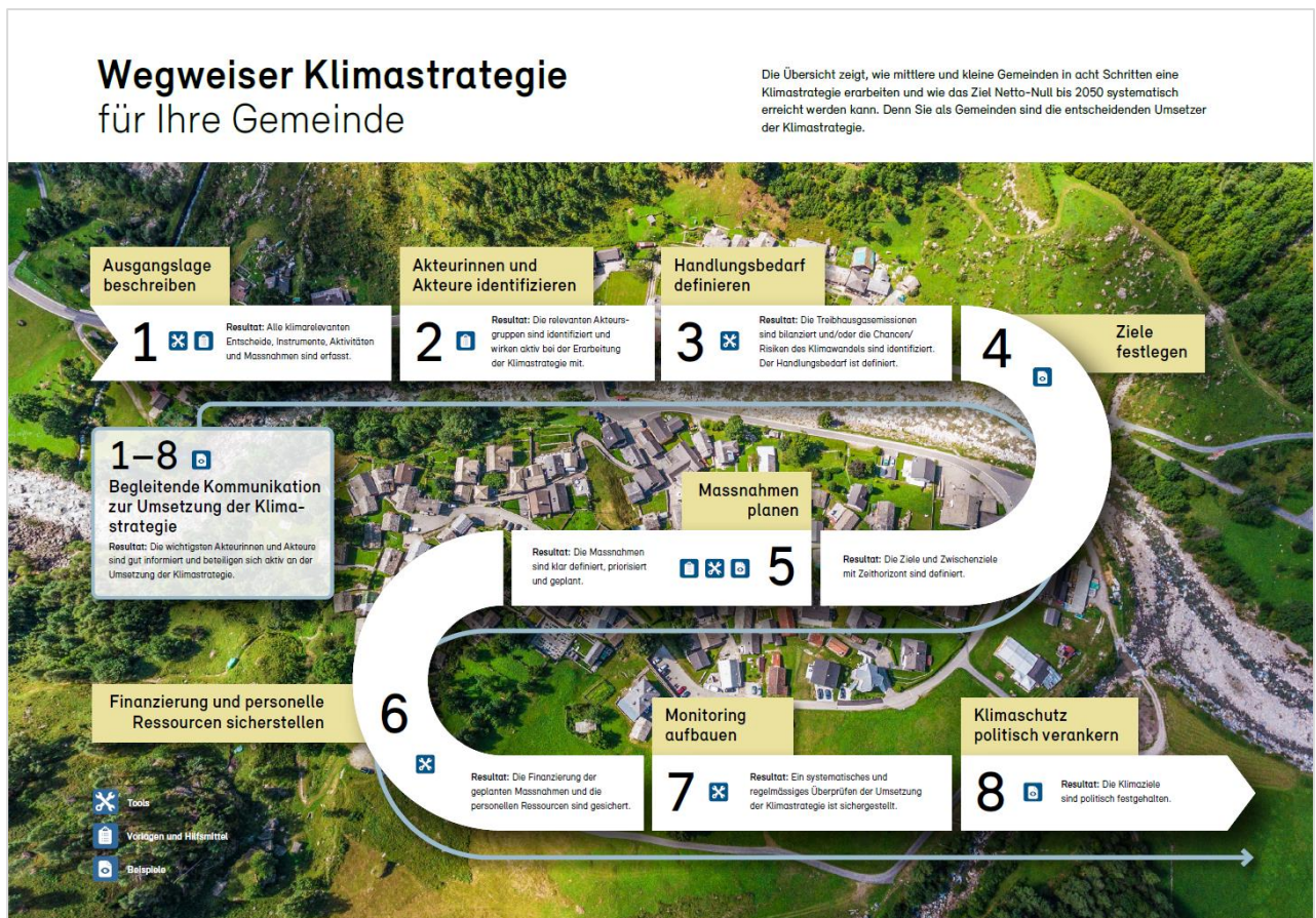
Abbildung 1: Wegweiser Klimastrategie

Hilfsmittel: Die Gemeinde Ostermundigen will bei der Erarbeitung der Energie- und Klimastrategie vorhandenes Wissen anderer Gemeinden, Vorlagen und finanzielle Unterstützung von Bund und Kanton möglichst umfassend nutzen. Angedacht ist, den erwähnten «Wegweiser Klimastrategie für Gemeinden» der Bundesämter für Umwelt und Energie als Leitfaden für die Erarbeitung der Energie- und Klimastrategie zu verwenden. Die einzelnen Schritte sind in untenstehender Abb. 1 kurz erklärt.