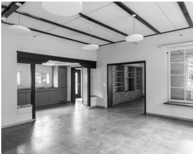
Kindergarten Alpenstrasse 12

Das Berichtsjahr war aus baulicher Sicht – neben zahlreichen kleineren und mittleren Unterhaltsmassnahmen – insbesondere geprägt vom Baubeginn der Sanierung und Erweiterung der Schulanlage Rothus sowie von der Inbetriebnahme der sanierten Kindergärten an der Alpenstrasse 12/14. Weitere Schwerpunkte bildeten die Dachsanierung der Garderoben im Freibad inklusive Installation von Solaranlagen, die Planung der Sanierung des Rasenspielfelds Rütli 2 sowie die Baueingabe für die neue Sporthalle an der Forelstrasse. Zudem wurden die Projektierungsarbeiten für das Verwaltungszentrum auf dem Tell-Areal sowie für die Sanierung und Umnutzung des Kindlerhauses aufgenommen.