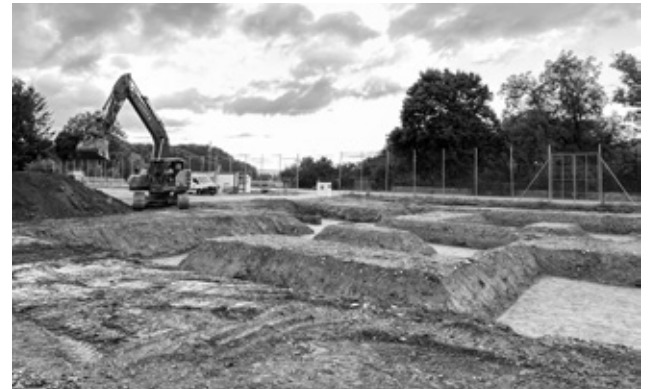
Erdarbeiten Erweiterungsbau Rothus

erteilt. Mit den Bauarbeiten wurde umgehend begonnen, die Inbetriebnahme ist auf Beginn des Schuljahrs 2027/28 geplant.