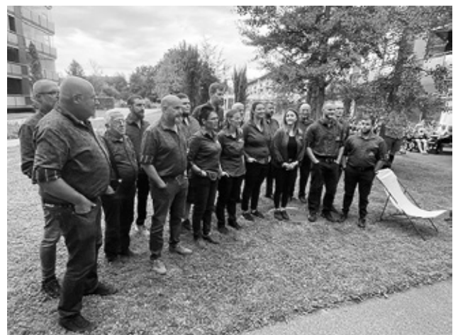
Jodlerklub Frohsinn Ostermundigen; Openair-Konzert im Tertianum vom Dienstag, 19. August 2025