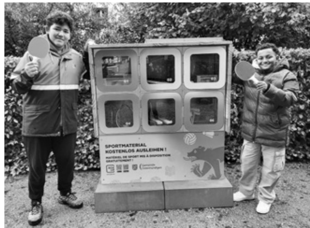
Jugendliche vor BoxUp

Im September wurde im Seepark eine Ausleihstation eingerichtet, über die Spiel- und Sportmaterial einfach per App ausgeliehen werden kann. Die Station verfügt über 6 Fächer mit Ausrüstung für verschiedene Freizeitaktivitäten wie Badminton, Kubb, Krocket und Tischtennis. Für die Nutzung ist eine einmalige Registrierung in der BoxUp-App erforderlich, die den kostenlosen Zugang ermöglicht. Die Station ist Teil eines kantonalen Projekts zur Förderung von Sport und Bewegung, das im Rahmen der UEFA Women's EURO 2025 initiiert wurde. Ostermundigen erhielt eine von 10 kostenfreien Ausleihstationen, um die sportliche Aktivität der Bevölkerung nachhaltig zu fördern.