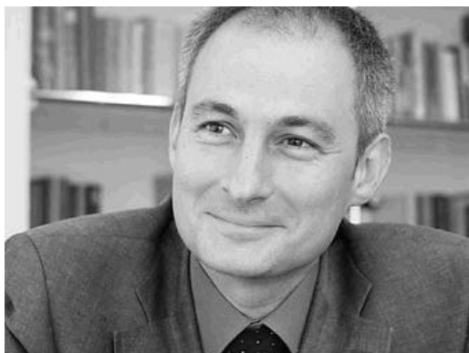
Bernhard Pulver, Direttore cantonale della pubblica istruzione