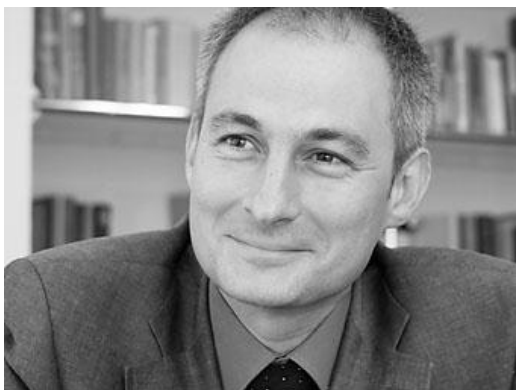
Bernhard Pulver, Gudoomiyaha waxbarashada iyo Barbaarinta